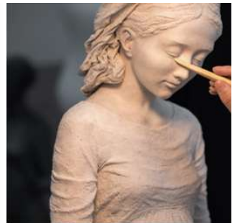
Fundación Hakuna de Hakuna (2018)